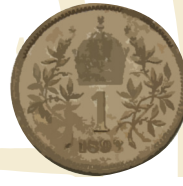
1 Krone 1893