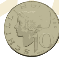
10 Schilling 1965

ist der Materialwert geringer als der Nennwert.