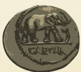
Denar, Julius Caesar

Mit römischen Münzen bezahlte man rund um das Mittelmeer und in fast ganz Europa. Auch im heutigen Österreich. Hergestellt wurden die Münzen