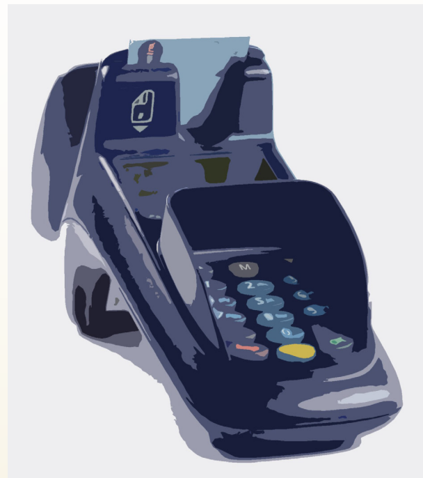
Bezahlterminal mit Debitkarte

Plastikgeld hat aber auch noch eine andere Bedeutung. Man kann statt mit Banknoten und Münzen auch mit Debitkarten oder Kreditkarten zahlen. Damit das funktioniert, muss man beim Zahlen einen geheimen Code, der PIN genannt wird und aus vier Ziffern besteht, eingeben. Bei Kreditkarten gibt es noch eine andere Methode. Hat man keinen PIN-Code, muss man die Rechnung unterschreiben.