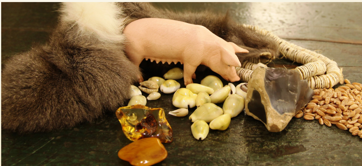
Tauschmittel und Naturalgeld

Es gibt heute auch noch den ganz klassischen Tauschhandel. Manche Ureinwohner in Südamerika, Afrika oder Ozeanien, verwenden oder kennen modernes Geld nicht. Aber es gibt zum Beispiel auch Tauschbörsen im Internet.